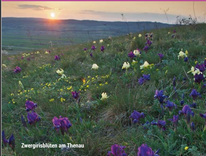
Zwergirisblüten am Thenau

LR08 über den Thenauriegel (Breitenbrunn)