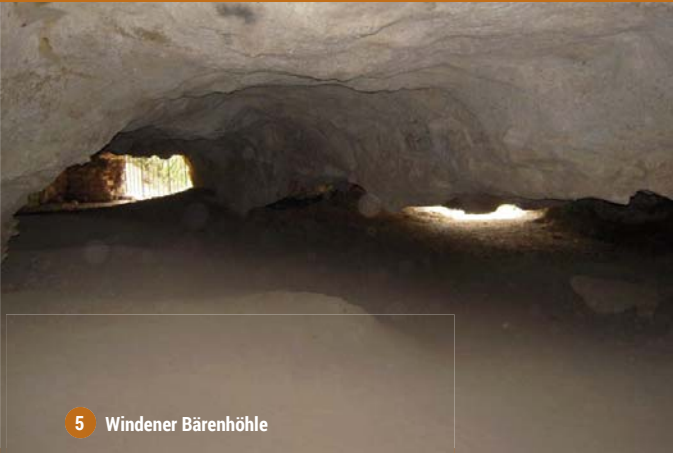
5 Windener Bärenhöhle