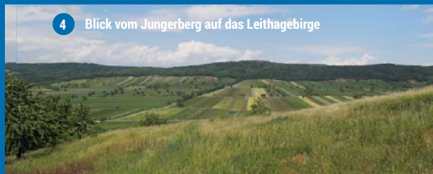
4 Blick vom Jungerberg auf das Leithagebirge