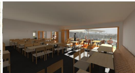
FRÜHSTÜCKSRaum / SEMINARRaum NACH ÖFFNUNG ZUM HAFEN