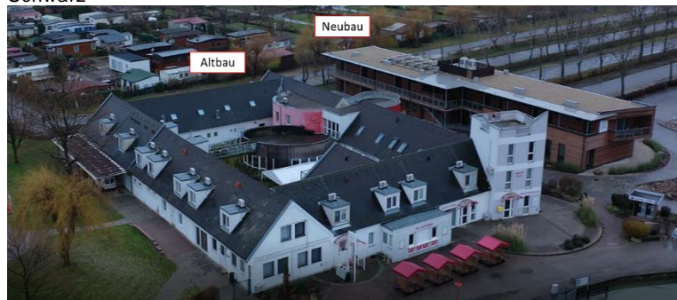
Abbildung 8: Ausbau Hotel am See-Rust, Copyright by Architekt DI Hermann Schwarz