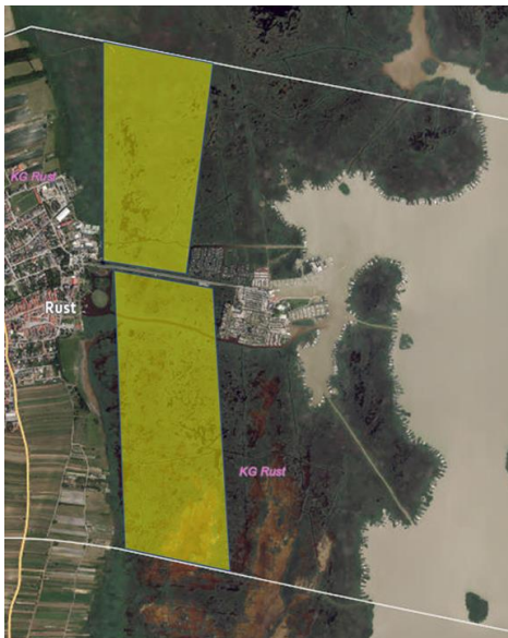
Abbildung 12: Schilfbewirtschaftung, Orthofoto GeoDaten Burgenland, eigene Darstellung