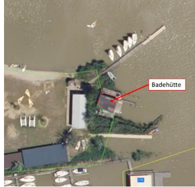
Abbildung 11: Badehütte hinter Hauptgebäude, Orthofoto GeoDaten Burgenland, eigene Darstellung