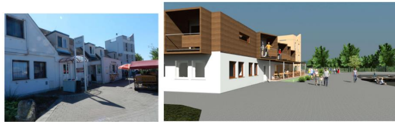
AUSSENFRONT ZUM HAFEN - BESTAND