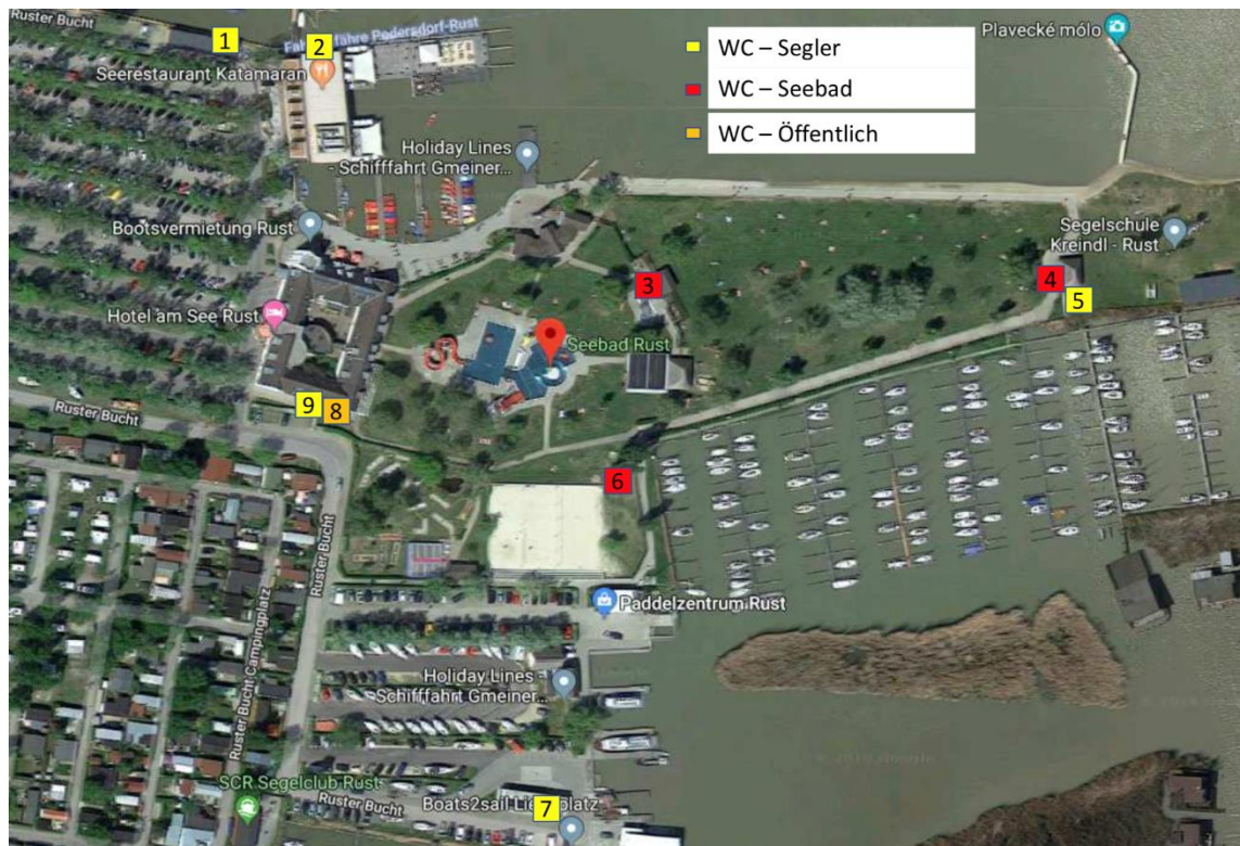
Abbildung 13: Sanitäreanlagen, Google Maps, eigene Darstellung