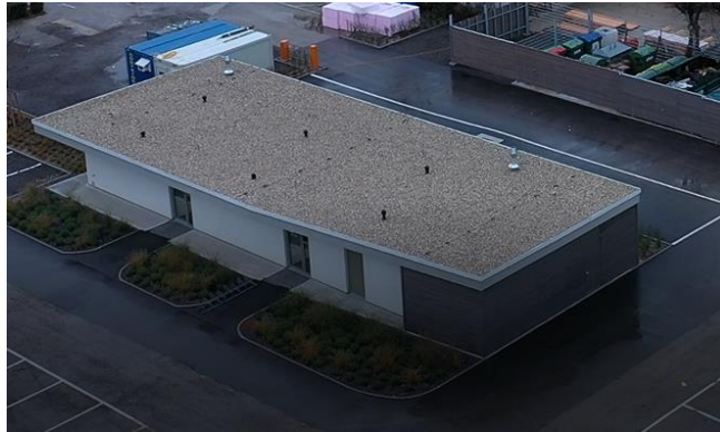
Abbildung 9: neues Sanitärgebäude am Campingplatz, Ruster SeebadbetriebsgesmbH