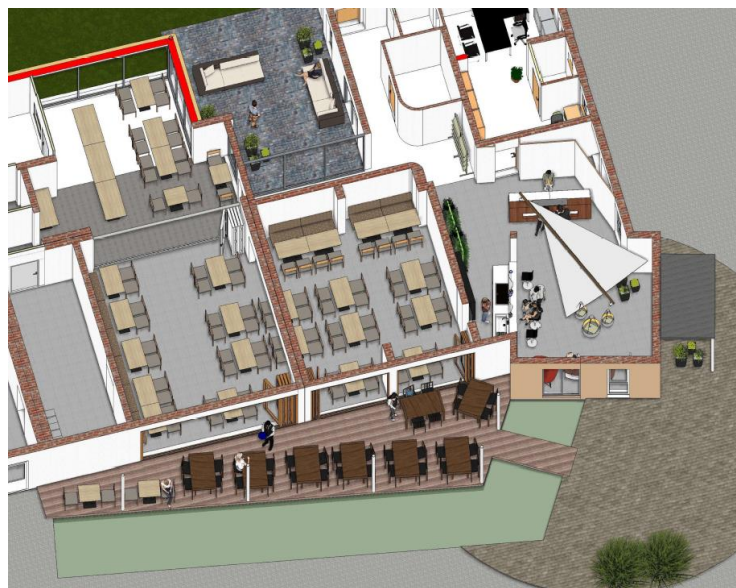
Abbildung 6: Hotel am See-Rust, Copyright by Architekt DI Hermann Schwarz