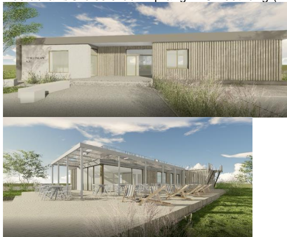
Abbildung 10: neues Restaurant am Campingplatz, Copyright by Halbritter und Halbritter ZT GmbH